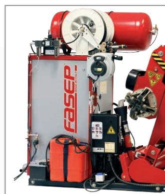
• generatore / electric generator