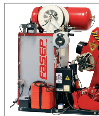
• generatore / electric generator

RGU2671.G version is nothing but RGU2671.GENSET only frame therefore without generator, compressor and electric-hydraulic power unit.