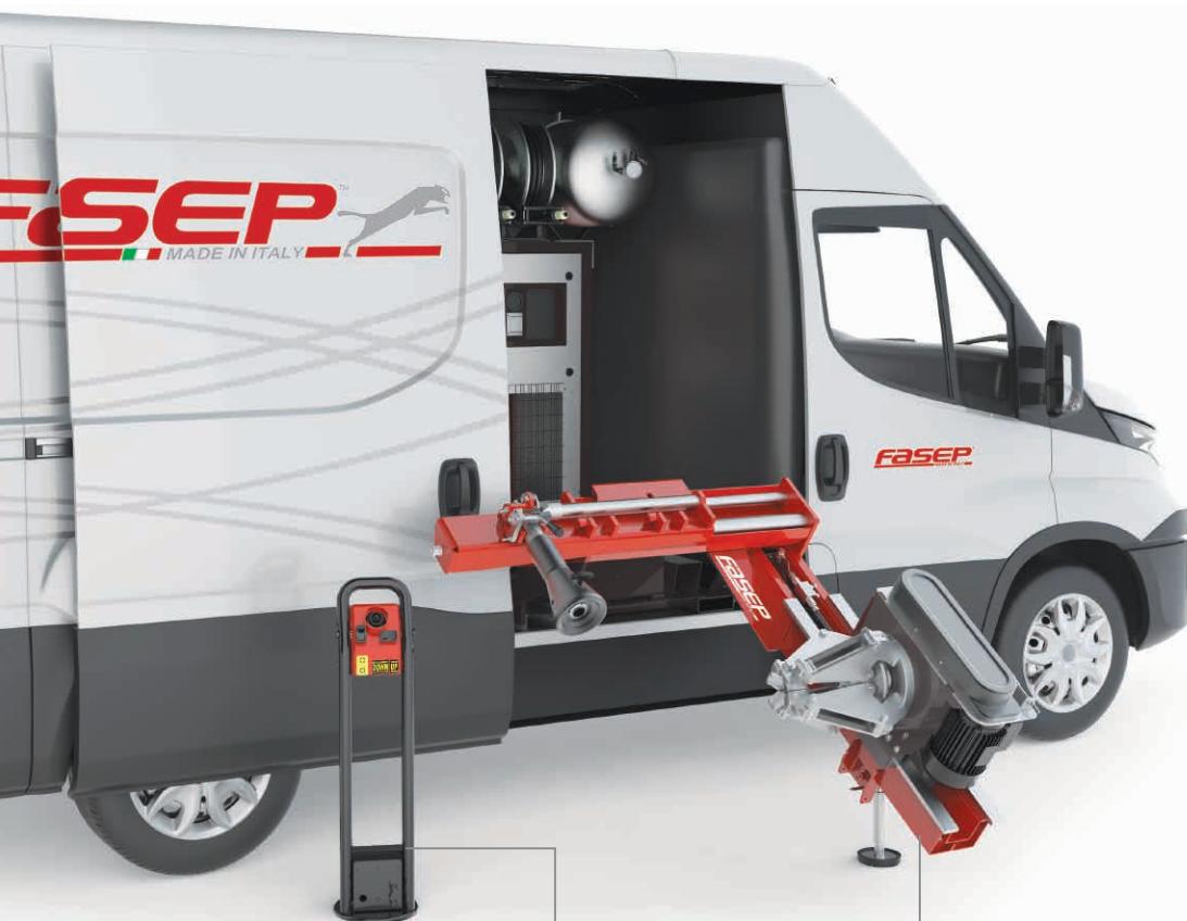
Consolle comandi idraulici. Hydraulic control console.

Automatic Truck Tyre Changer for Mobile service on Trucks and Buses (intensive use)