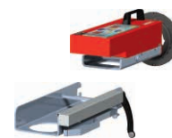
B160.T su carrello FLIP B160.T on FLIP trolley

Mandrino elettroidraulico. Hydraulic clamping chuck system.